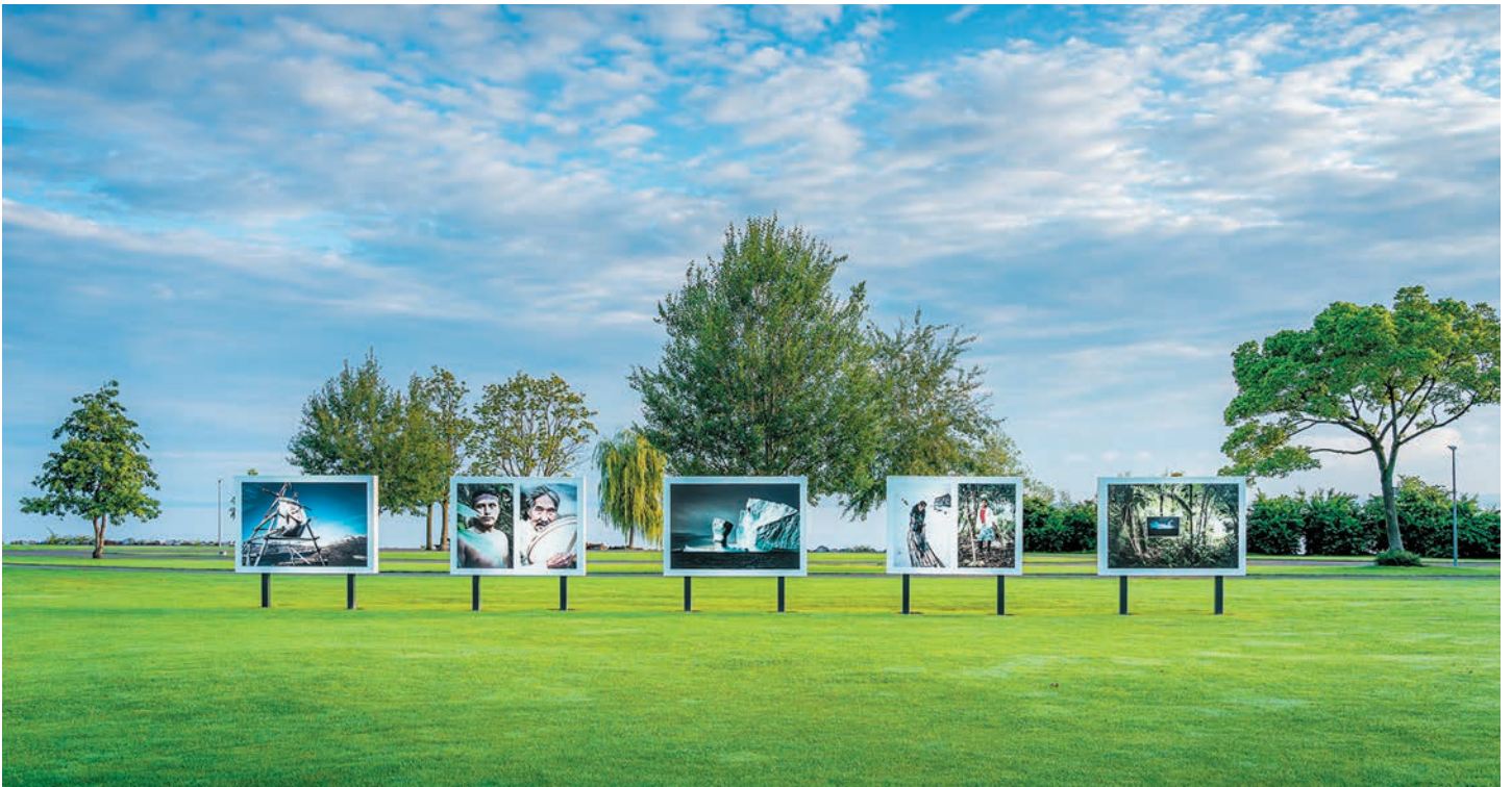
Ein kleiner Einblick in die Ausstellung Tropic Ice am Bodensee .