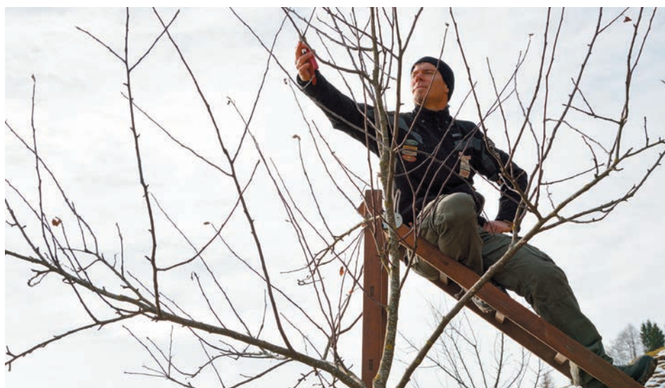
Obstbaumschnitt im Dezember