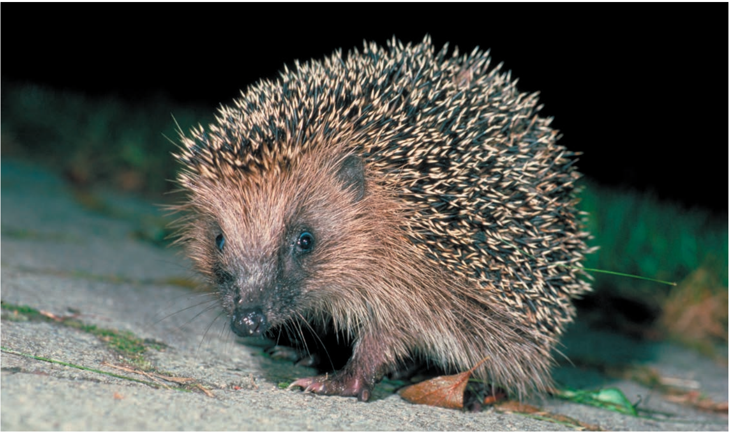
Igel verschlafen den Winter.