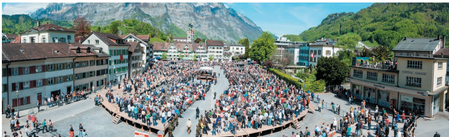
An der Landsgemeinde in Glarus wird das fortschrittlichste Energiegesetz der Schweiz beschlossen.