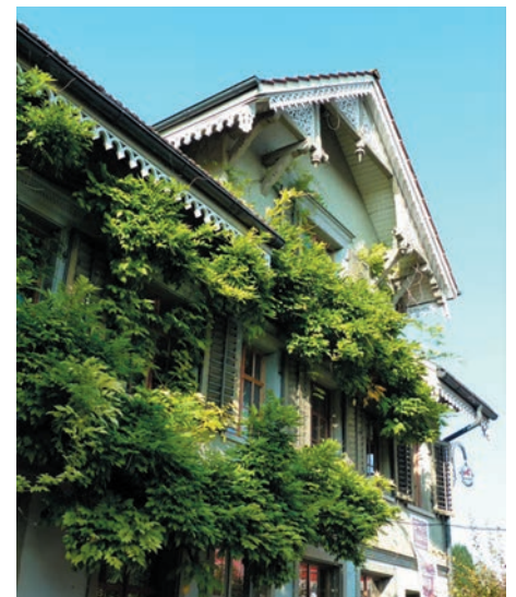
Ein einladender Anblick von Aussen.