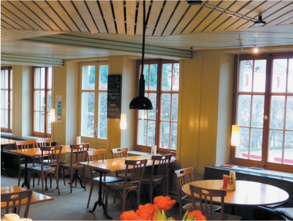
Gemütliche Atmosphäre im Restaurant Löwen in Sommeri am Bodensee.

Den Löwen in Sommeri könnte man schon fast als Traditionsbeiz bezeichnen, würde das nicht Kopfbilder von einer Landbeiz mit währschaftem Wurst-Käse-Salat entstehen lassen. Das Restaurant zwischen Amriswil und Güttingen am Bodensee ist jedoch vielmehr eine Genossenschaftsbeiz-Pionierin sowie Vorreiterin einer innovativen fleischlosen Küche.