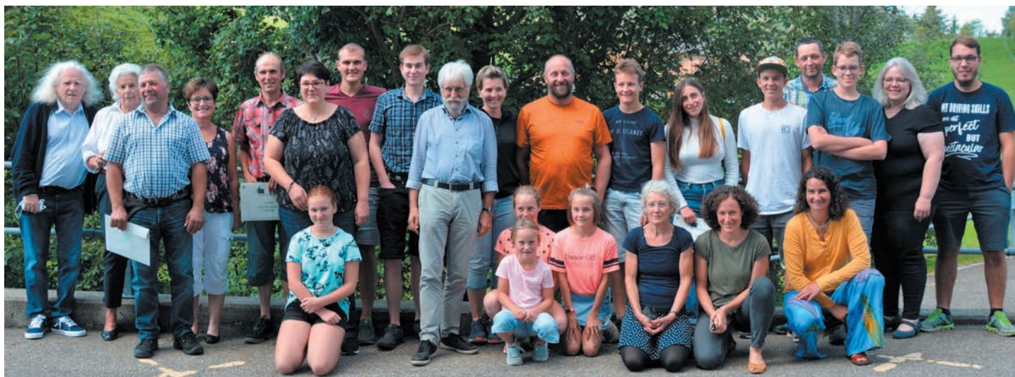
Die Preisträger der Heckenmeisterschaft 2021 in Appenzell Ausserrhoden mit ihren Familien.