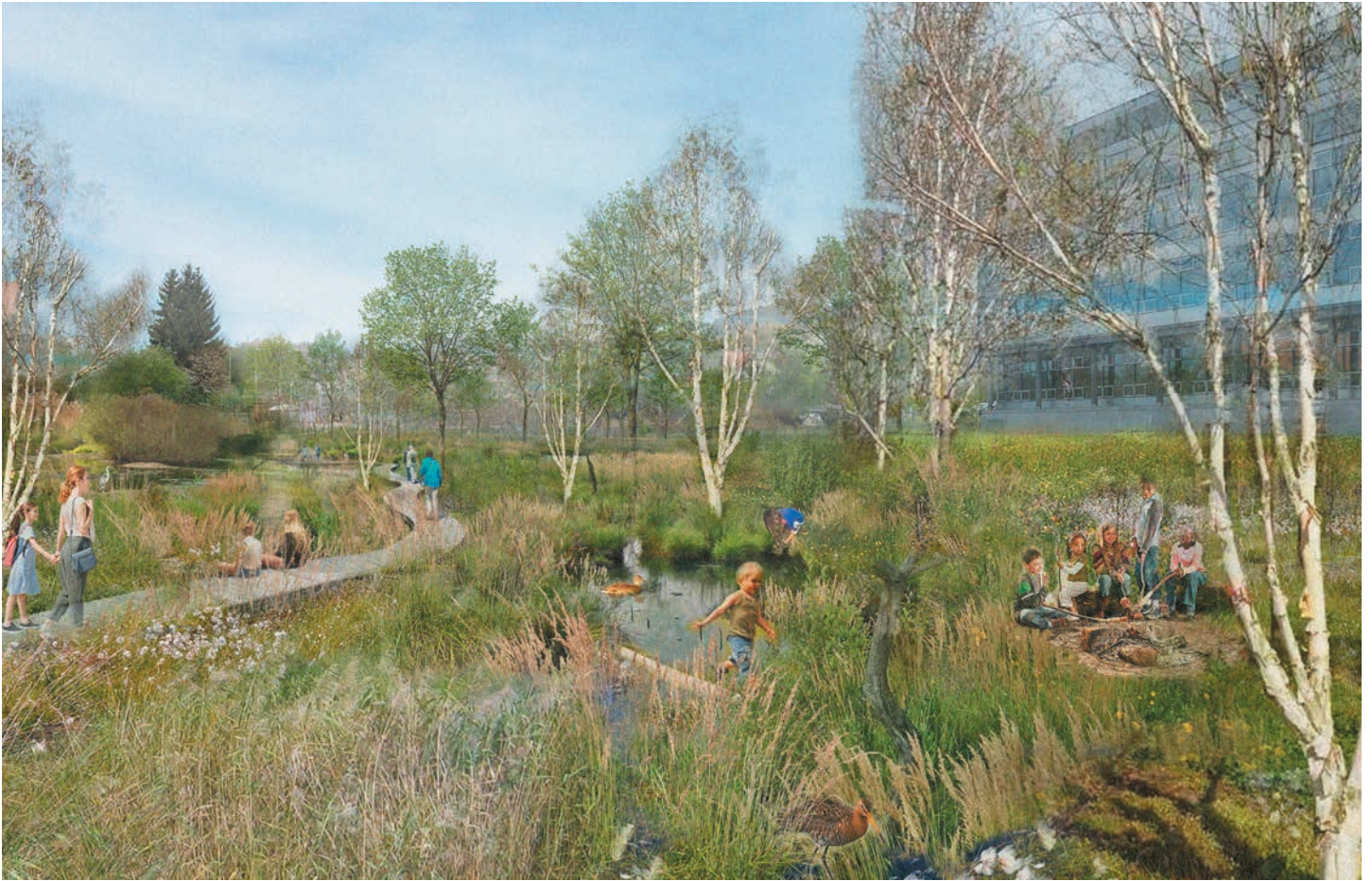
Visualisierung des aufgewerteten EMPA-G in St.Gallen.

Ausgabe 4/2021, WWF Regiobüro AR/AI-SG-TG, Merkurstrasse 2, 9001 St.Gallen, 071 221 72 30, regiobuero@wwfost.ch, wwfst.ch WWF Glarus, Bahnhofstrasse 1, 8852 Altendorf, 055 640 84 09, info@wwf-gl.ch, wwf-gl.ch, Spenden: PC-Konto 89-222961-7