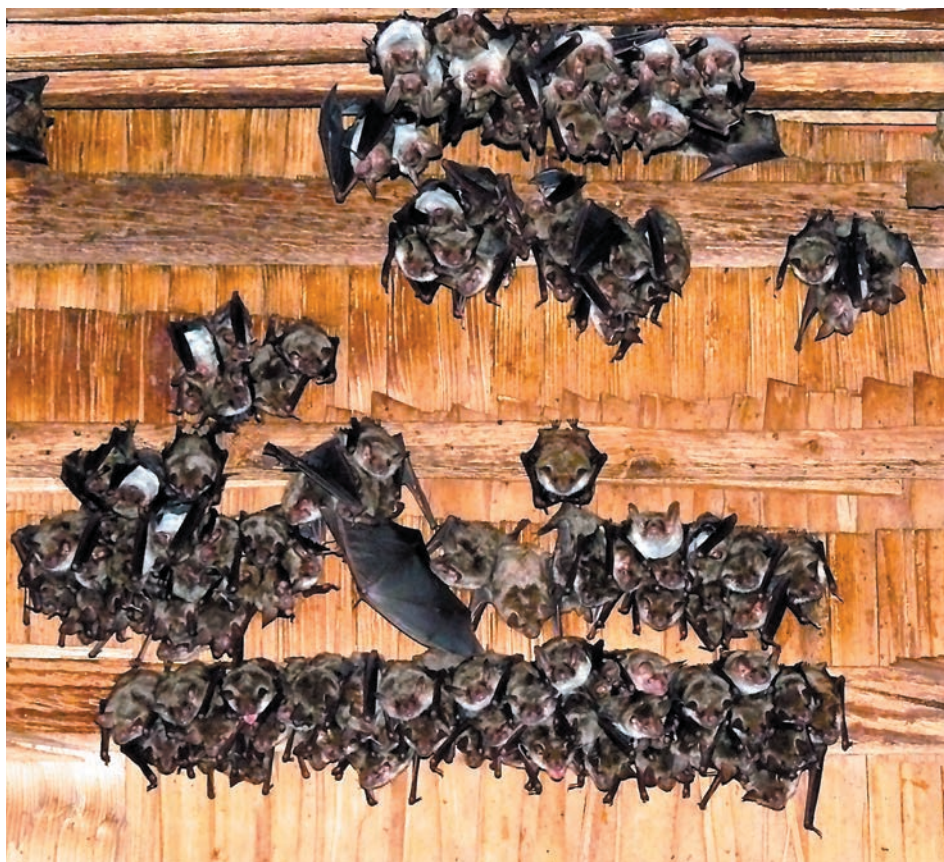
Die Wochenstube der Grossen Mausohren in Lipperswil.