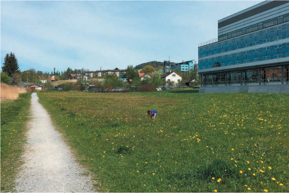
Das aktuelle EMPA-G an der Lerchenfeldstrasse.

Erreichen der Pariser Klimaziele sowie den nationalen Zielen des ökologischen Ausgleichs im Siedlungsgebiet einen Schritt näherbringen könnte.» Auch wenn die darin enthaltenen Massnahmen noch weiterentwickelt werden müssen, ist doch klar, aus welchen Bestandteilen sie bestehen sollten, damit die übergeordneten Ziele erreicht werden können.