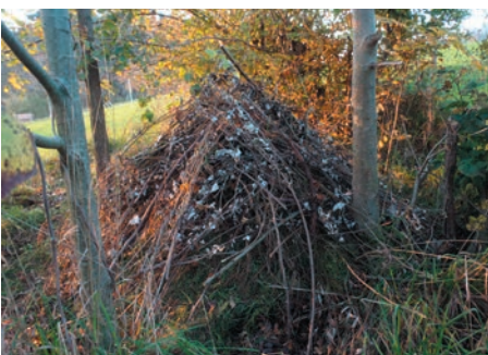
Ein Ast-Laub-Haufen stellt einen natürlichen Unterschlupf für Igel dar.

Von Herbst bis Frühling halten Igel ihren Winterschlaf. Sie ziehen sich in einen Hohlraum, unter Holz- oder Laubhaufen zurück und richten sich ein gemütliches Nest für die kalte Jahreszeit ein. Dort rollen sie sich zum Schlafen zusammen und überwintern so. Ab und zu erwachen sie, leeren Darm und Blase und schlafen wei-