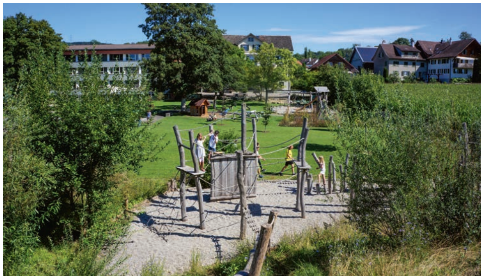
Heilpädagogische Schule Mauren (TG): Ein Beispiel für eine kind- und naturgerechte Schulhausumgebung.