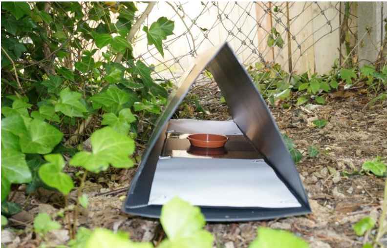
Seitenansicht mit Einlage