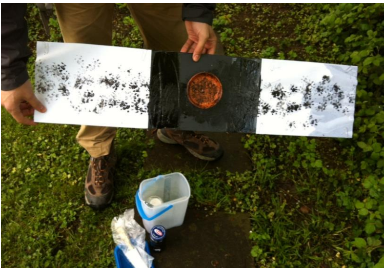
Einlage mit Igel-Fussabdrücken