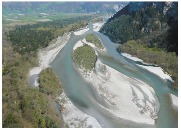
Visualisierung der für die Anhebung der Rheinsohle bis Buchs äusserst bedeutsamen Aufweitung bei Sargans-Fläsch, wie im Entwicklungskonzept Alpenrhein (2005) vorgezeichnet.