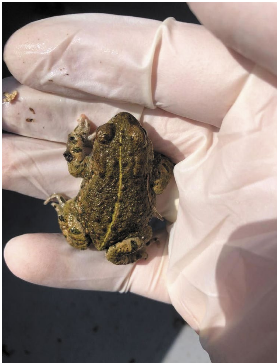
Einer von Tausenden: Ein Grasfrosch vor der Rückführung in einen geeigneten Lebensraum.