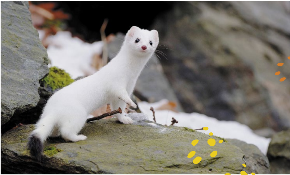
Hermeline wechseln ihr Fell im Winter und werden weiss. Die schwarze Schwanzspitze, an der man sie einfach vom Mauswiesel unterscheiden kann, bleibt.

diversitätshecken, Natursteinmauern und Buntbrachen entstehen, damit die Ostschweizer Kulturlandschaft wieder wieselfreundlich und ökologisch vernetzt ist. Daneben profitieren auch noch unzählige weitere Lebewesen von einer strukturreichen Landschaft – beispielsweise Igel, Zauneidechsen, Ringelnattern, Wildbienen, Goldammer usw. Doch auch die Landwirtschaft profitiert – mit einer Wieselfamilie auf dem Hof ist eine nachhaltige und kostenlose Mausbekämpfung gewährleistet.