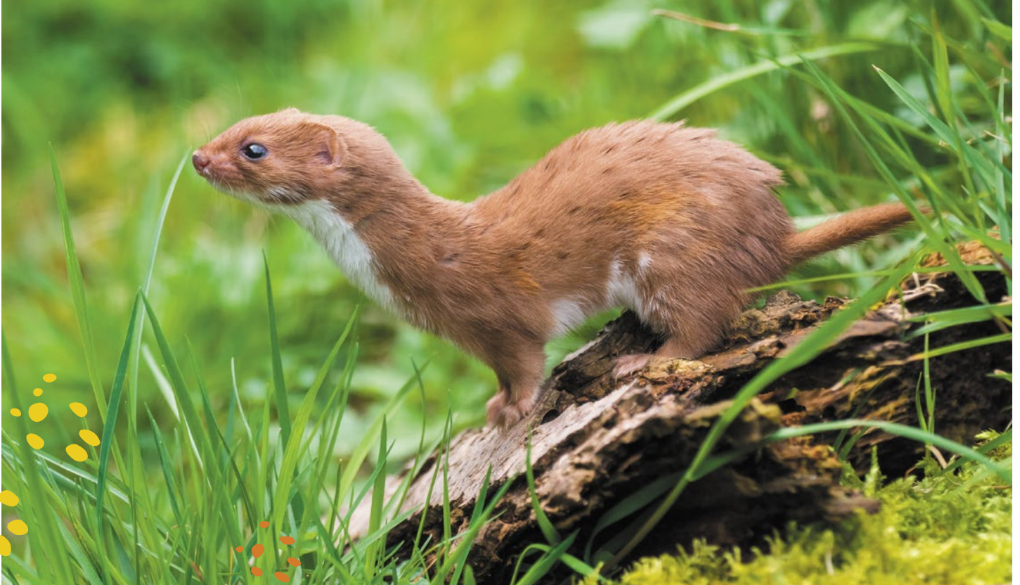
Das Mauswiesel ( Mustela nivalis ) ist das kleinste Raubtier der Welt.

Ausgabe 1/2023, WWF Regiobüro AR/AI-SG-TG, Merkurstrasse 2, 9001 St.Gallen, 071 221 72 30, regiobuero@wwfost.ch, wwfost.ch