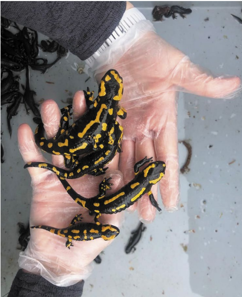
Leider auch häufige Gäste in der ARA Au: Feuersalamander.