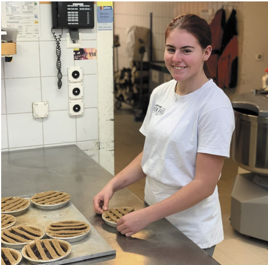
In der KORN.HAUS-Bäckerei arbeiten auch Lernende tatkräftig mit.