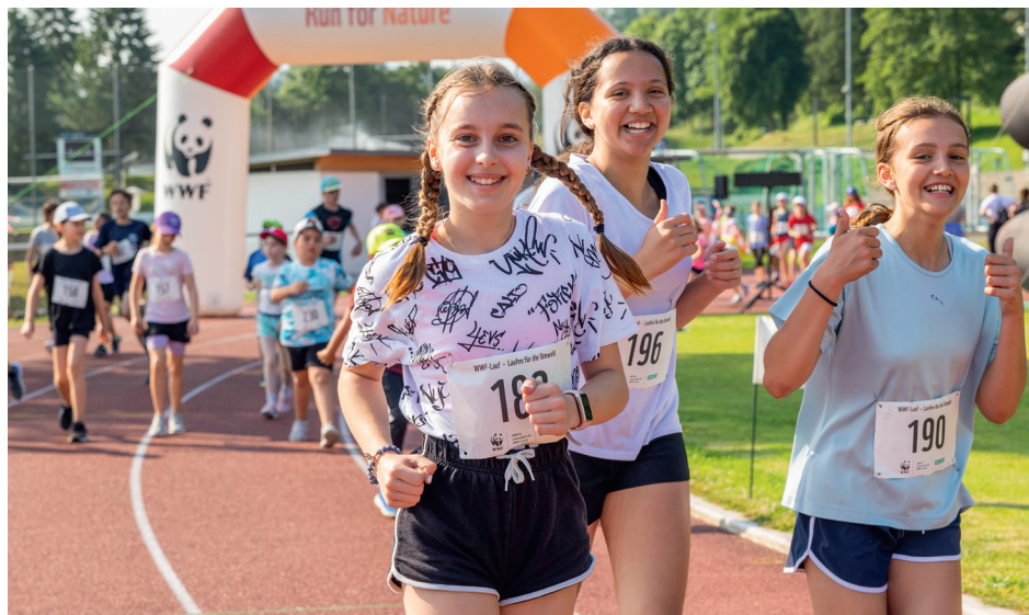
Vom Kindergarten bis zur Oberstufe: Die Laufteilnahme ist ein unvergessliches Erlebnis.

stellt das Eventmaterial zur Verfügung und unterstützt bei der Planung. Dies bietet Flexibilität und ermöglicht es jeder Schule, einen Lauf zu einem passenden Zeitpunkt zum persönlichen Wunschthema durchzuführen.