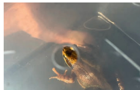
Während der Exkursion geretteter Grasfrosch.

Die an der Exkursion teilnehmende Fünftklässlerin Nina fand, dass alle Schächte eine Ausstiegshilfe haben müssten und sich jede ARA für Amphibienrettungsmassnahmen einsetzen sollte.