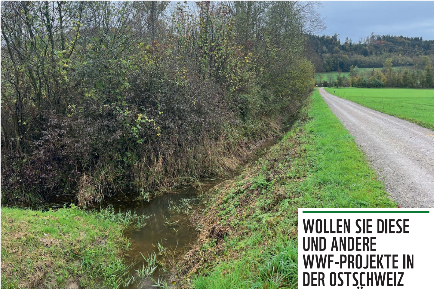
Noch ist der Widenbach kanalisiert – dank dem WWF soll er renaturiert werden.

Im WWF Regiobüro Ostschweiz läuft einiges! Wir setzen uns in den Kantonen St.Gallen, den beiden Appenzell und Thurgau für die Natur vor der Haustüre ein. Nachfolgend ein Einblick in unsere neusten Projekte.