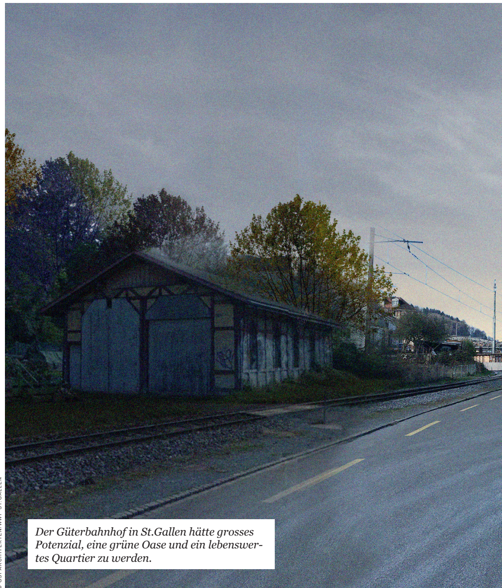
Der Güterbahnhof in St.Gallen hätte grosses Potenzial, eine grüne Oase und ein lebenswertes Quartier zu werden.

denseeufer zwischen Kreuzlingen und Rorschach lagen diese Pläne ebenfalls in den 60er-Jahren auf. Es folgte eine epische Auseinandersetzung, unter anderem mit einer erfolgreichen Beschwerde des WWF im Bereich des Seerückens oberhalb von Kreuzlingen. Danach setzte die Regierung auf die T14; diese sollte dem Thurtal entlang erst in Romanshorn auf den Bodensee stossen. Doch auch dieses Projekt fiel beim Stimmvolk durch. Neu geht es um einen sogenannten Netzabschluss, eine T13 light, die bei der Abstimmung angenommen wurde. Nach wie vor ist aber nicht klar, in welcher Form sich der Bund engagieren wird. Für Projekte, wo auch Wald und Kulturland zubetoniert