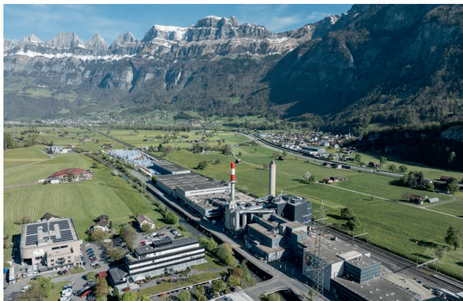
Die Flumroc zeigt, dass die Umstellung auf erneuerbare Energie auch in der Industrie möglich ist.

Nein, überhaupt nicht. Der Wettbewerb ist hart und wir müssen uns kontinuierlich weiterentwickeln, um ganz vorne dabeizubleiben. Das ist eine gesunde Situation und ich bin froh, dass es so ist.