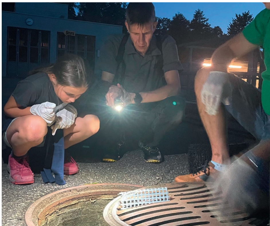
An der Exkursion wurden Gefahren für Amphibien (z. B. Schächte) vorgestellt.