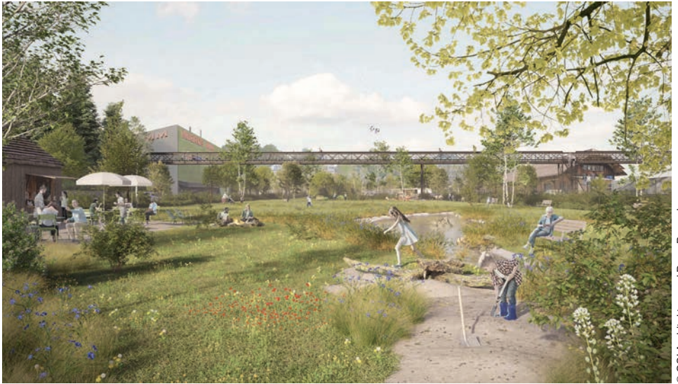
© GSI Architekten und Daan Beugels

Das wäre auf der heutigen Industriebrache möglich.