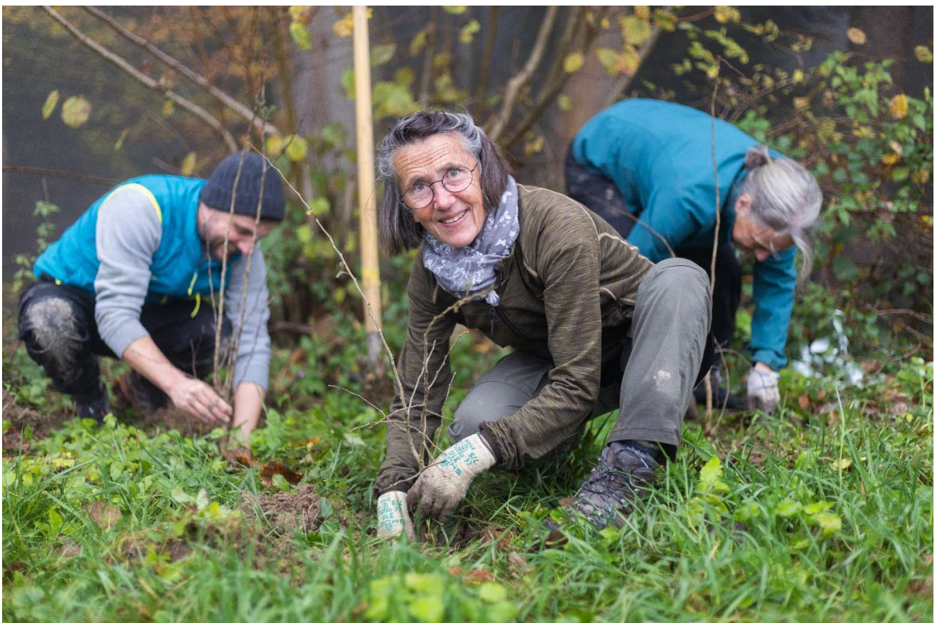
Abbildung 2: Freiwillige bei der Heckenpflanzung im Unteren Brand, St.Gallen SG