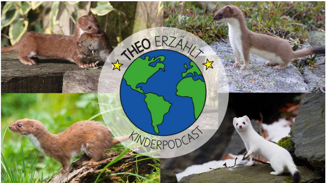
Abbildung 4: Der kostenlose Podcast «Hermelin und Mauswiesel» ist über Youtube und Spotify verfügbar.

In Zusammenarbeit mit dem Team des bekannten Schweizer Kinderpodcasts „ Theo erzählt “ wurde eine Folge zum Thema Wiesel produziert. Ziel war es, Kinder und Familien für die Thematik zu sensibilisieren. Die Folge mit dem Titel „ Hermelin und Mauswiesel “ ist kostenlos auf YouTube und Spotify verfügbar.