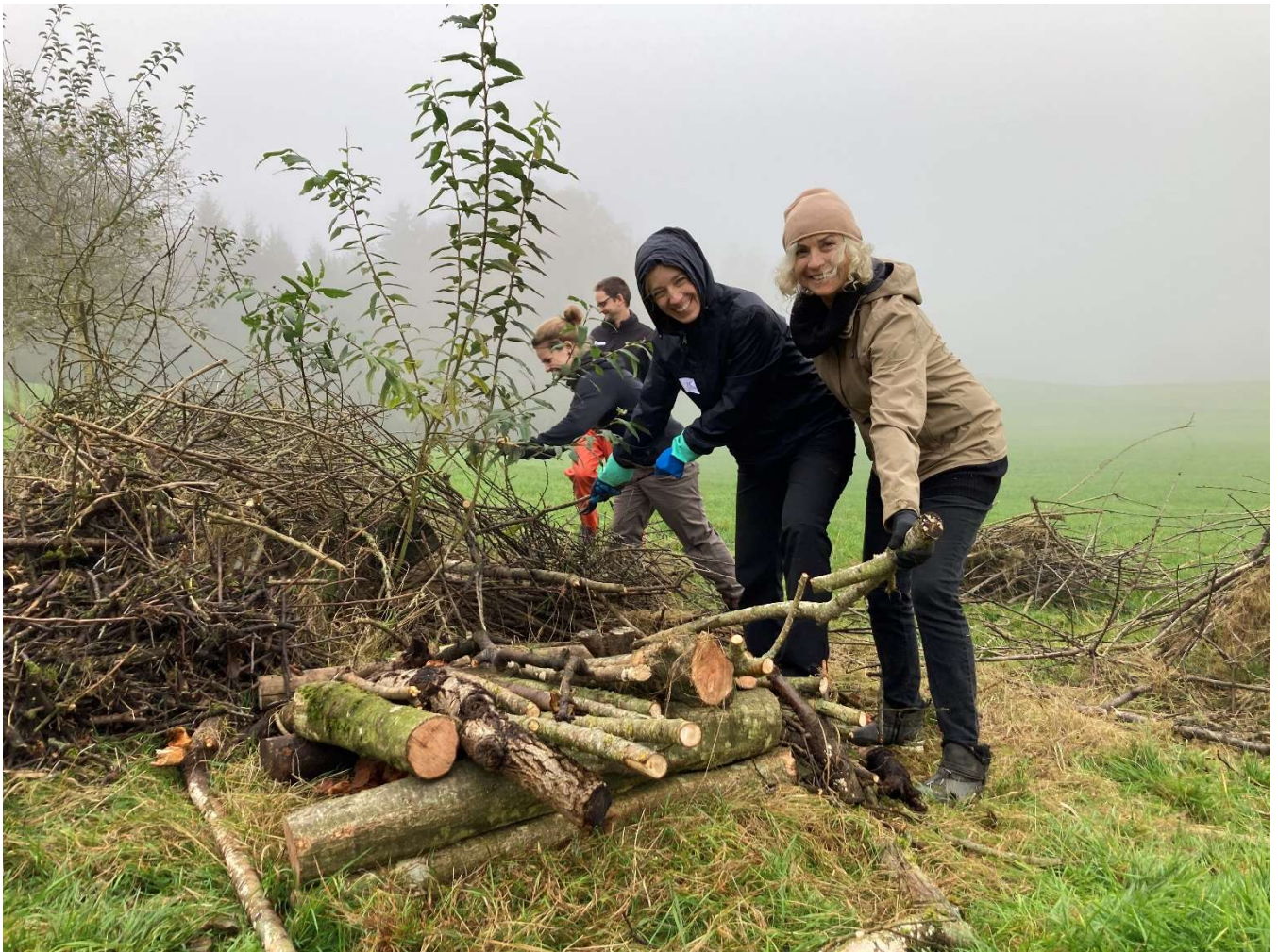
Abbildung 1: Freiwillige beim Bau von Wieselburgen in St. Pelagiberg TG

Das Wieselprojekt fand in der gesamten Ostschweiz grossse Resonanz. Insgesamt wurden 63 Landwirt:innen zum Thema Wiesel beraten. Zahlreiche Aufwertungsmassnahmen konnten in Zusammenarbeit mit Geflüchteten, Freiwilligen und Schulklassen realisiert werden. Besonders erfreulich ist die Neuanlage von über 1'600 Metern Biodiversitätshecken der Qualitätsstufe 2 . Zudem wurden 500 Meter Waldrand aufgewertet, 40 Meter